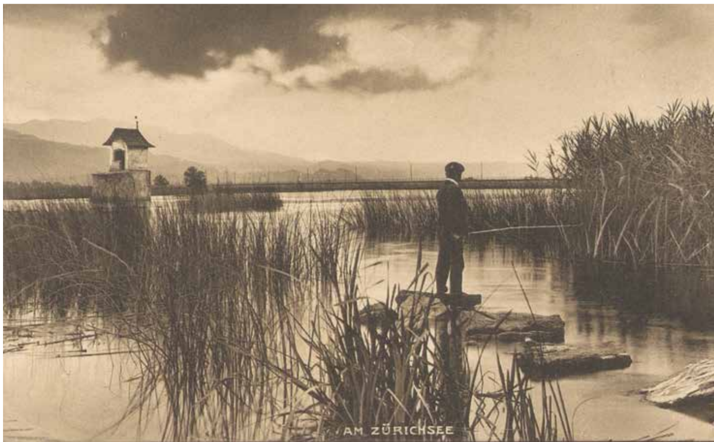
Am Zürichsee, Carl Künzle-Tobler, Postkarte aus dem Nachlass Dora Fanny Rittmeyer, undatiert, Kantonsbibliothek St.Gallen

Parkmöglichkeit: Spelteriniplatz, Brühltor