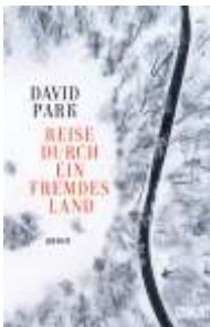
David Park Reise durch ein fremdes Land (DuMont)