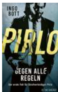
Ingo Bott Pirlo: Gegen alle Regeln (Scherz)