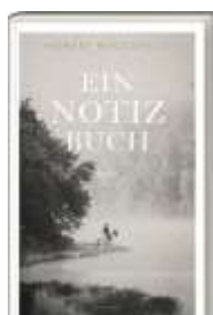
Hubert Mingarelli Ein Notizbuch * (Ars Vivendi)