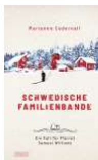
Marianne Cedervall Schwedische Familienbande (DuMont)