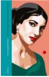
Eva Baronsky Die Stimme meiner Mutter (Ecco)