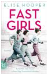
Elise Hooper Fast Girls * (Rütten & Loening)