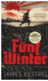
James Kestrel Fünf Winter* (Suhrkamp)