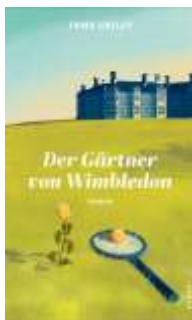
Jane Crilly Der Gärtner von Wimbledon* (Kampa)

* Diese Titel gibt es auch als eBook oder eAudio (Dibiost)