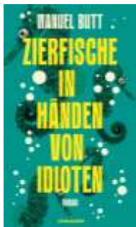
Manuel Butt Zierfische in den Händen von Idioten (Kein & Aber)