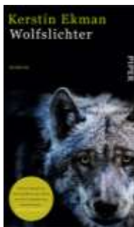
Kerstin Ekman Wolfslichter (Piper)