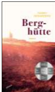
Fanny Desarzens Berghütte* (Atlantis)