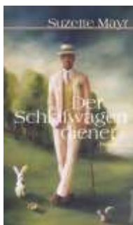
Suzette Mayr Der Schlafwagendiener* (Wagenbach)